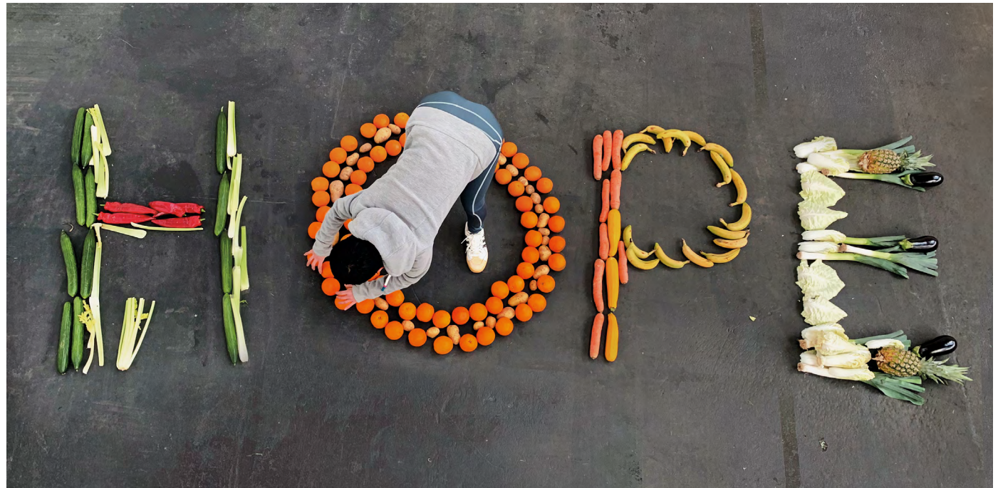
THE UNALPHABET IS THE NEW RESEARCH LABORATORY TO ANALYZE THE CONTRADICTIONS OF WESTERN CULTURE

Due to the shifting plans I decided on a more local way