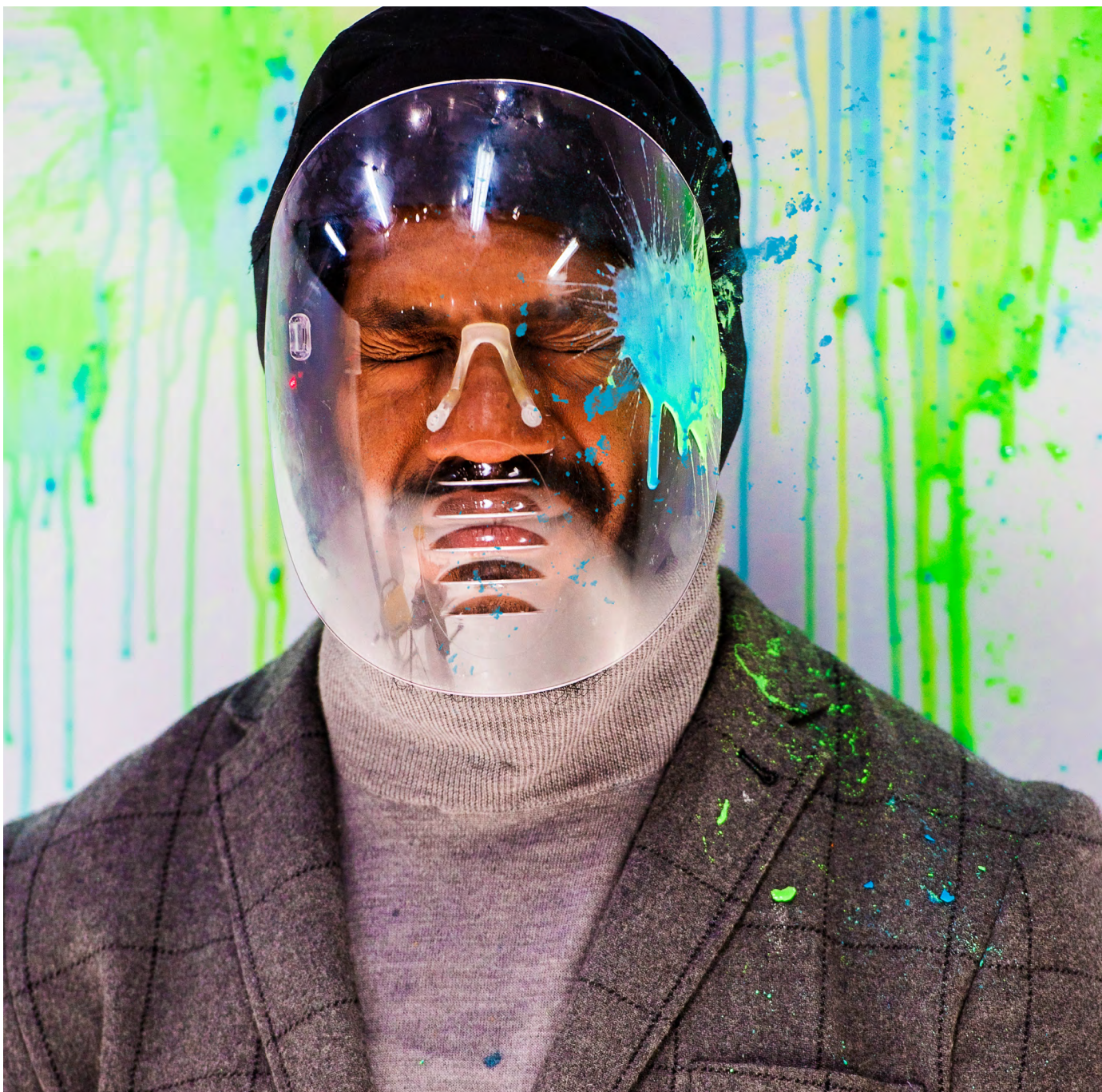
THE AUTOMATED SNIPER: PERFORMANCE BIJ HET HEM, ZAANDAM, 2021