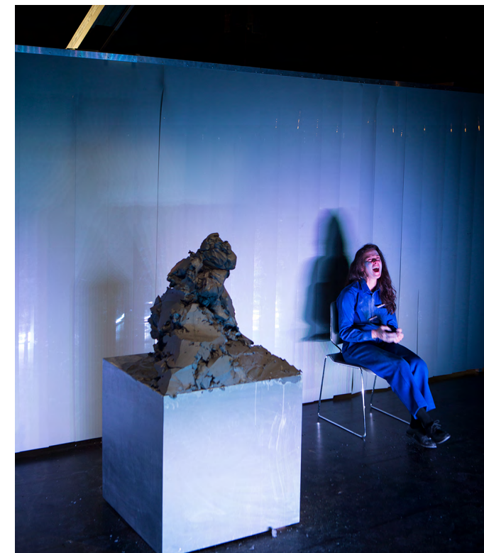
MOUNT AVERAGE: OFFICIËLE JURYSELECTIE NEDERLANDS THEATER FESTIVAL

In 2022 zal google analytics in de nieuwe website geïntegreerd worden waardoor we meer inzicht kunnen verkrijgen in het publiek dat we bereiken. Aan de hand van de cijfers kunnen we onze communicatiestrategie uitbouwen en aanpassen waar nodig.